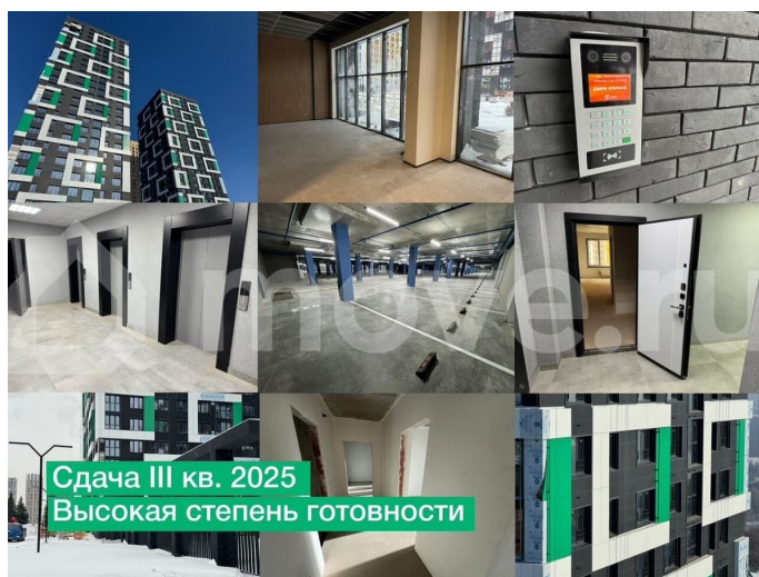
фото: февраль 2025

Сдача III кв. 2025 Высокая степень готовности