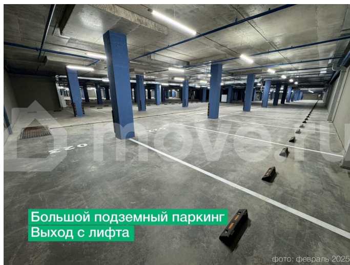
фото: февраль 2025

Скоростные бесшумные лифты Пассажирские и грузовой