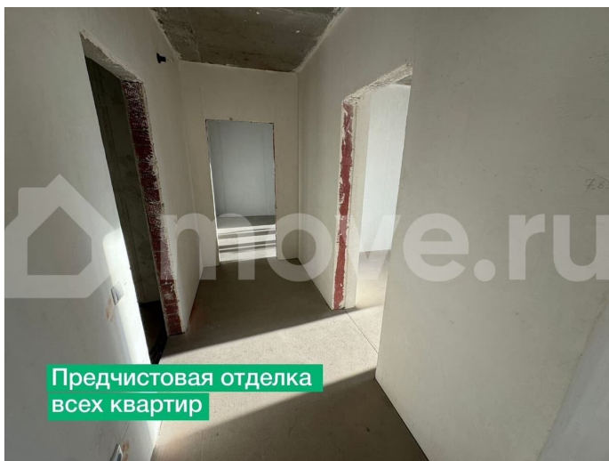
Предчистовая отделка всех квартир