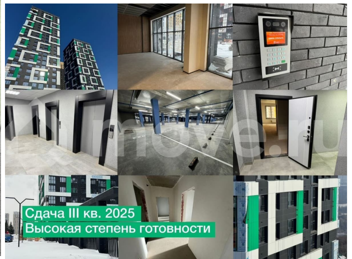
фото: февраль 2025

Сдача III кв. 2025 Высокая степень готовности