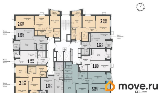
СЕКЦИЯ 1. ПЛАН 3, 8, 12, 13, 19, 20, 21 ЭТАЖЕЙ