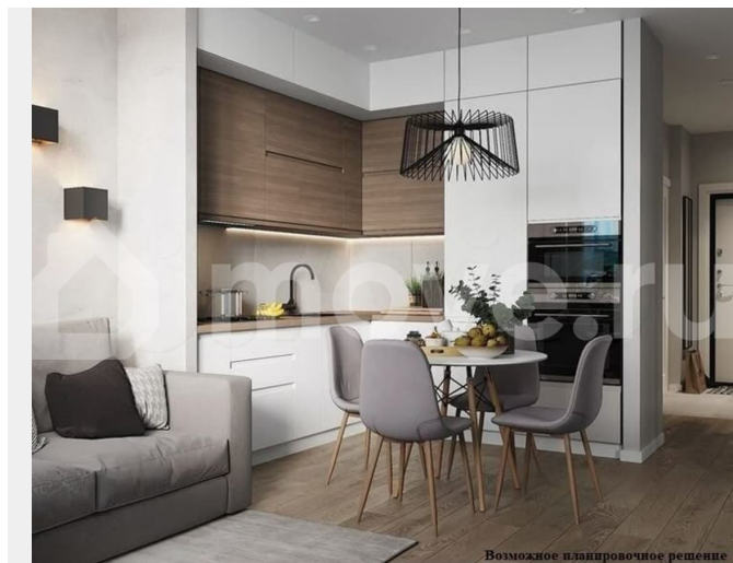
Возможное планировочное решение